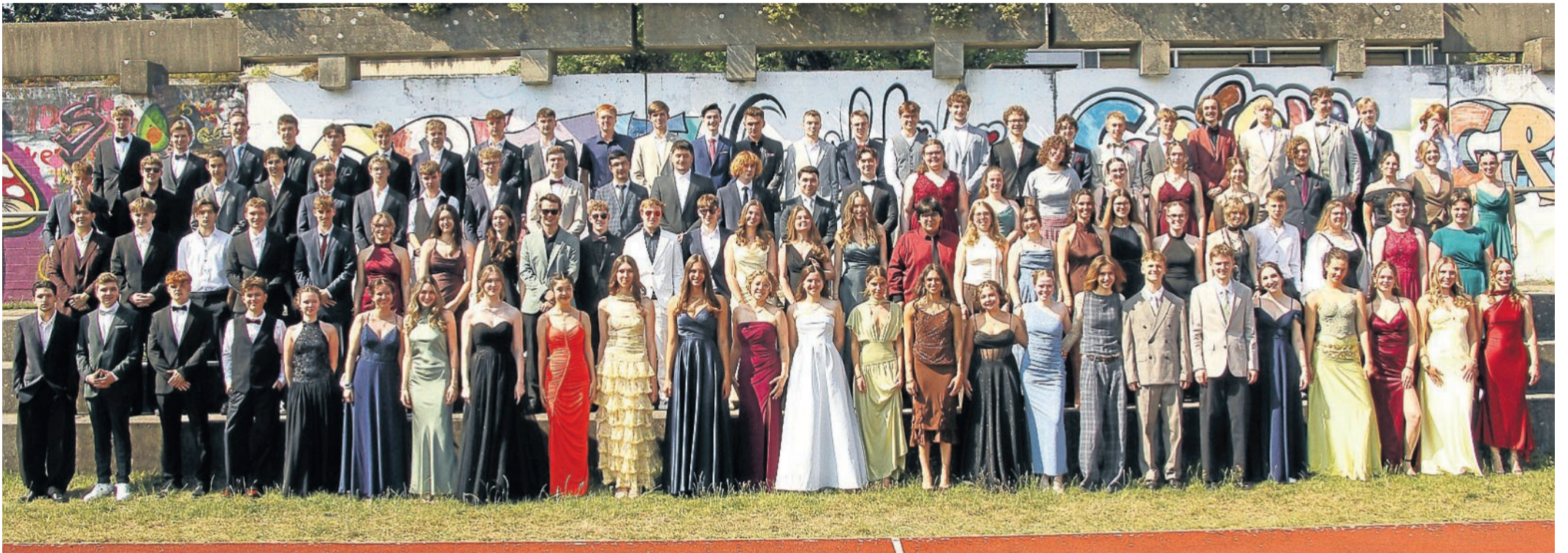
104 Abiturienten haben am Laufer Christoph-Jacob-Treu-Gymnasiums heuer ihr Reifezeugnis erhalten.

SCHULABSCHLUSS Ausgelassen haben die Absolventen das Ende ihrer Schullaufbahn gefeiert. Über den roten Teppich gingen sie zur Zeugnisübergabe.